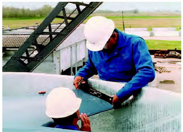
FIG. 1 Il est important de savoir où prendre la lecture du pas.

Ventilateurs non étanches. Normalement, on devrait voir la lumière du jour directement à travers les faisceaux de tubes, et c'est également une excellente façon de déterminer si les tubes ont besoin d'un nettoyage. Si on peut voir des trous et des ouvertures lorsque l'on jette un coup d'œil à partir du bas des unités de tirage forcé,