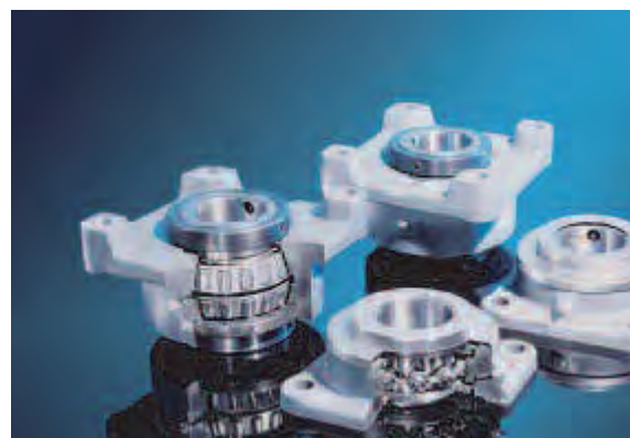
FIG. 9 Paliers de ventilateurs à ailettes de Hudson