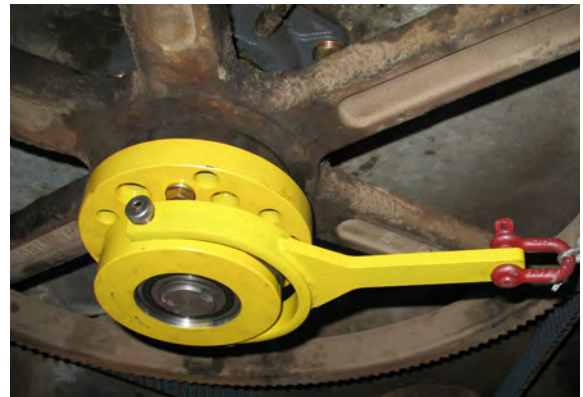
FIG. 10 Le dispositif antirotation DG-II