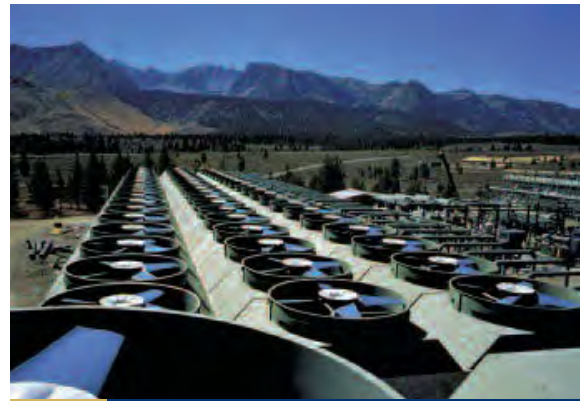
FIG. 8 Ventilateurs à rendement élevé

Nouveau. Le dispositif antirotation DG-II (Fig. 10) s'adapte à toutes les configurations de raccord standard bien que certaines applications puissent nécessiter un espaceur. Les ingénieurs offrent une solution sécuritaire pour les ventilateurs de refroidissement d'air à entraînement par courroie avec arbre vertical.